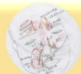
褥瘡の質的スケッチ技法