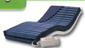
エアマットレスの共同開発