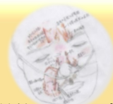
褥瘡の質的スケッチ技法