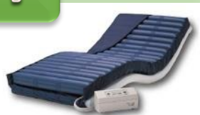
エアマットレスの共同開発