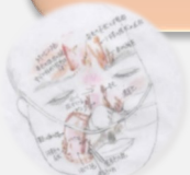
褥瘡の質的スケッチ技法