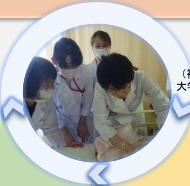
褥瘡回診の様子 (褥瘡ケアを行う教員、 大学院生と病院スタッフ)