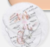
褥瘡の質的スケッチ技法